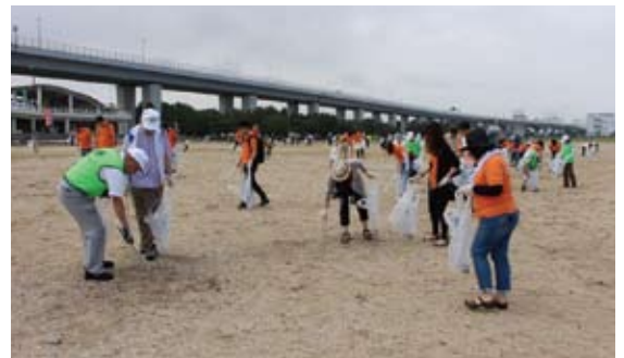
平成30年6月24日 貝塚市二色の浜海岸美化運動