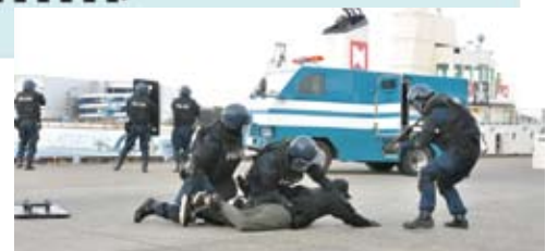
昨年の堺泉北港でのテロ対策総合訓練の様子

◎堺泉北港・阪南港では、保安対策(テロ対策)の一環として、毎年、テロ対策総合訓練を、関係する各関係機関と合同で実施しております。昨年は、11月28日と12月12日に実施しました。