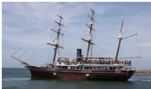
チャーターしたうずしお観光船咸臨丸

また、泉州南広域消防本部の消防フェアでは、20mはしご車への体験搭乗に行列ができるなど、人気を集めました。