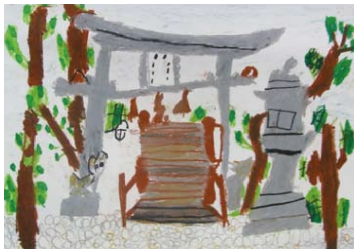
第58回「親と子の写生会」大阪府港湾協会賞 丸畑 拓也(小1)

大阪府港湾協会 大阪府営港湾振興webサイト FRIEND & SHIP http://www.osakaprefports.jp/