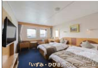
「いずみ・ひびき」スイートルーム