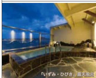
「いずみ・ひびき」露天風呂

〒592-8585 高石市加茂4丁目1番1号 高石市政推進部経済課内 TEL.072(265)1001 FAX.072(263)8143