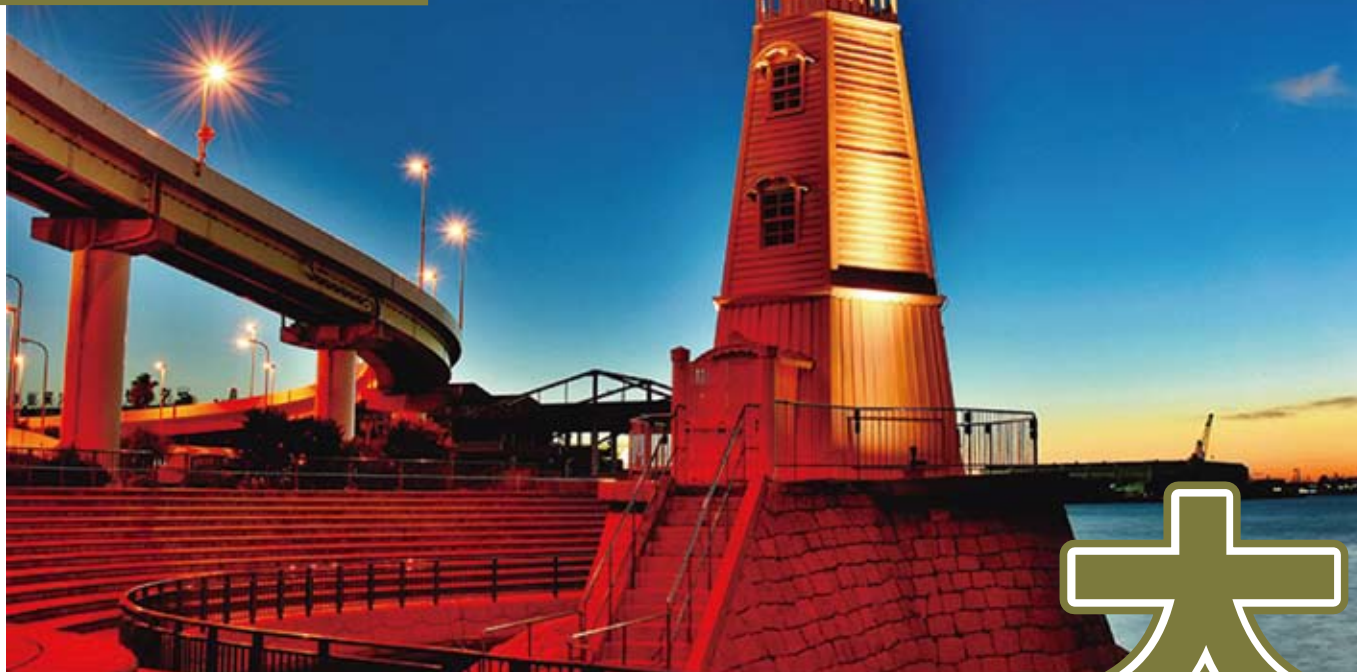
第40回海の写真コンクール 特選 大阪府知事賞【ライトアップ：岩井 英二】