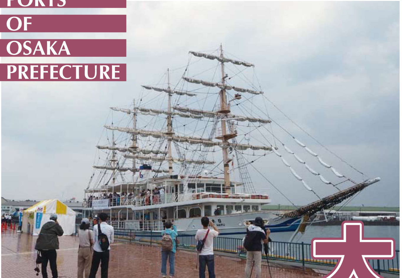
堺泉北港 50 周年記念イベントで泉大津旧港に入港した「日本丸」