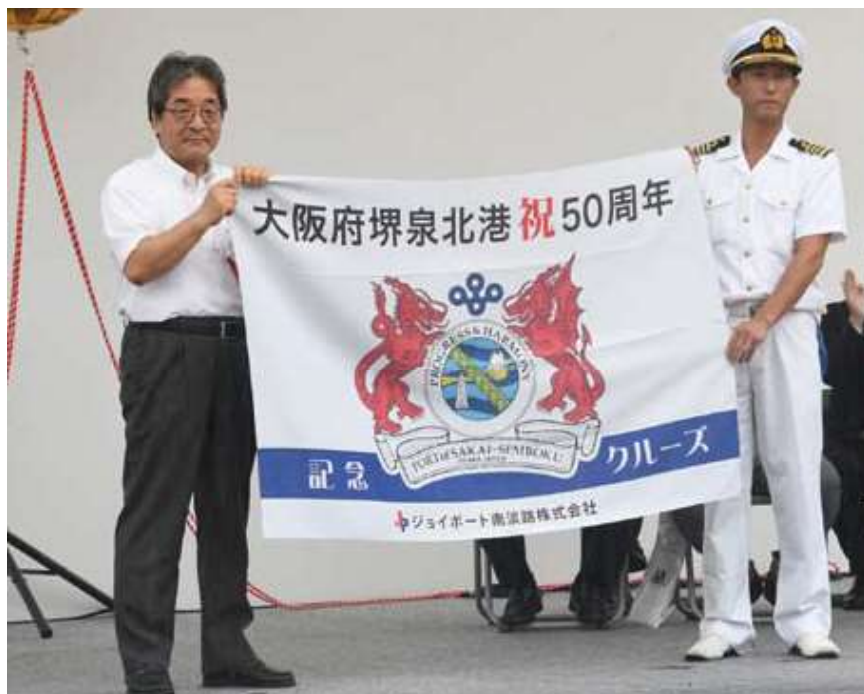
○記念式典(田中副知事から「日本丸」船長への記念旗贈呈)

イベント冒頭の「記念式典」では、大阪府からは田中清剛副知事が、地元からは各市長が出席、国会議員や府議会・地元市議会や国機関から来賓をお招きし、港の歴史にお祝いのことばをいただきました。