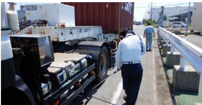
点検鏡により、入構車両の下部を目視点検