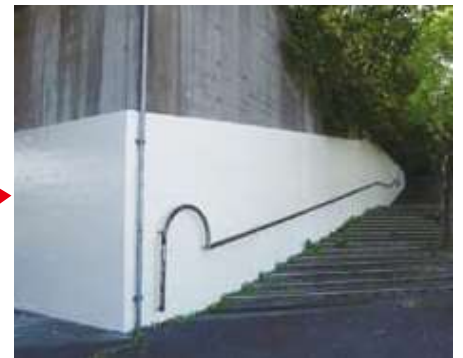
活動の様子及び仕上がりの写真