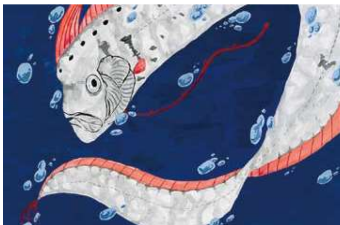
第56回 中学生海の絵画コンクール 銀賞 大阪府知事賞「竜宮の使い」日根野谷 思希