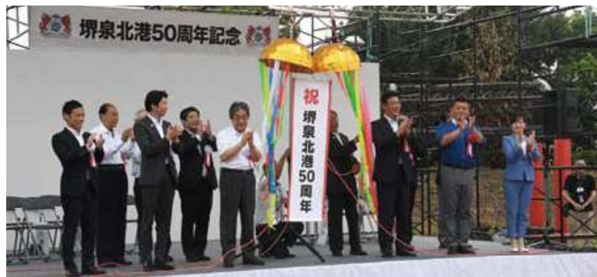
○記念式典(関係者による「くす玉」割り)

ブースイベントには47の企業・団体に参加いただきました。各社・各団体の事業や取扱商品・サービスのPR、来場者を楽しんでもらえるようなクラフトや飲食を提供するブースが軒を並べました。