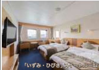
「いずみ・ひびき」スイートルーム