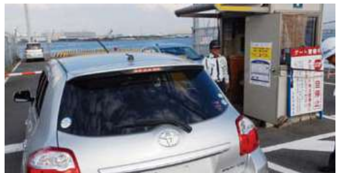
府職員も立ち合いのうえ、警備員による出入管理の強化・徹底