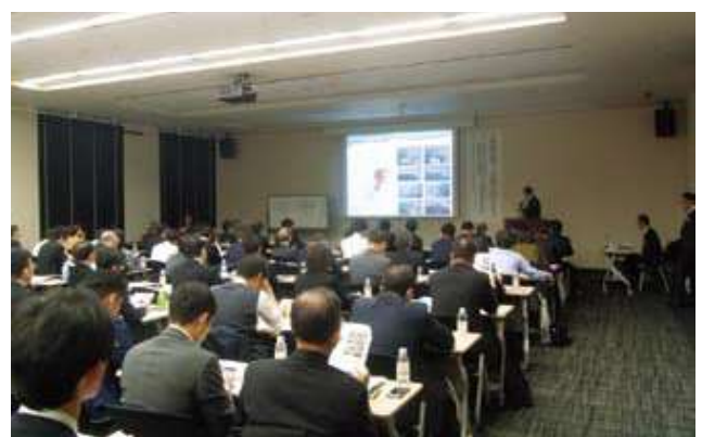
昨年の会場の様子

近年ではドライバー不足解消やCO2削減等が見込まれるモーダルシフトや、地震等の災害時の輸送リダンダンシーの確保が必要とされている中、より港湾の役割が増してきております。この度のセミナーではこのような港湾における現状を踏まえ、大阪府営港湾の特徴やメリット、関連団体の紹介・PR等を積極的に行っていく予定です。