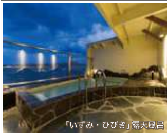
「いずみ・ひびき」露天風呂