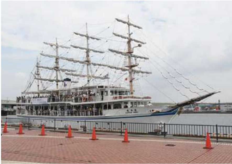
○「日本丸」による記念クルーズ